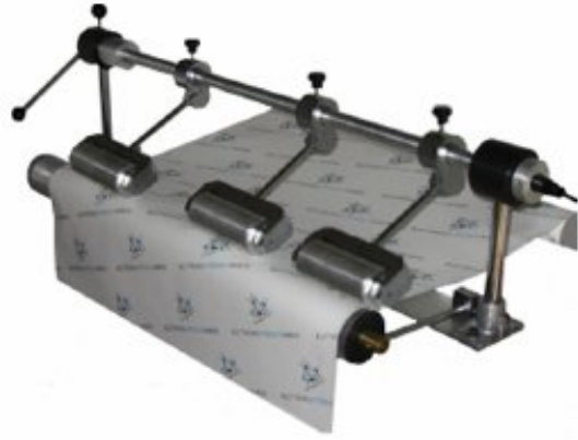
Kumaş Nemi Ölçümü