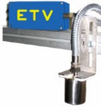
Kumaş ısı ölçümü