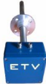
Çıkış havası ölçümü